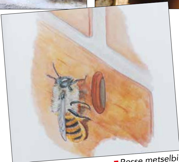
■ Rosse metselbij